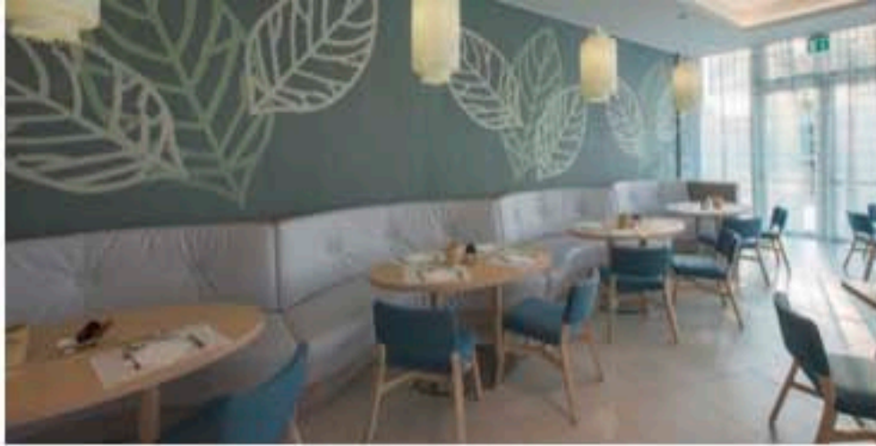
Particolare della sala da pranzo

Caratterizzate da una notevole solidità formale, le sedute Croissant sono contraddistinte da una struttura in faggio naturale o sbiancato, in abbinamento a sedile e schienale in tessuti di un'ampia gamma di colori e finiture. Nell'hotel sono state utilizzate le versioni sedia, poltroncina e lounge per la zona ristorante e la versione sgabello con schienale a completamento del bancone situato nella zona bar.