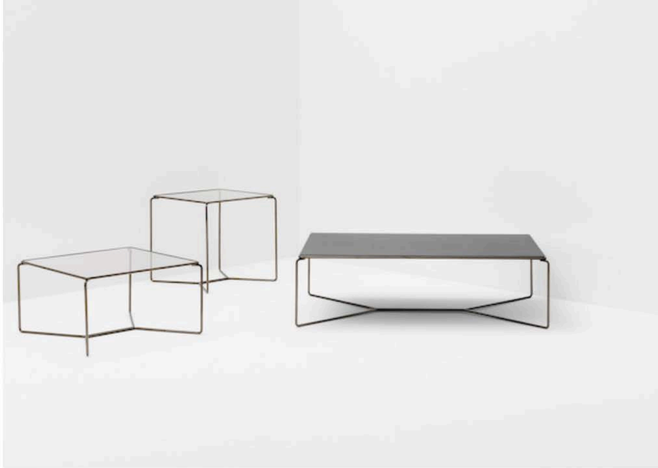
Marcel by Billiani

L'accordo per la riedizione del tavolino Marcel è stato siglato tra Billiani e l'erede di Kazuhide Takahama, essendo scomparso il designer nel 2010. Il figlio di Takahama supervisiona qualità, prestazioni ed estetica del prodotto edito dall'azienda e garantisce che ogni intervento interpretativo - in questo caso nuove altezze e materiali alternativi - rispecchi spirito e senso del progetto del padre.