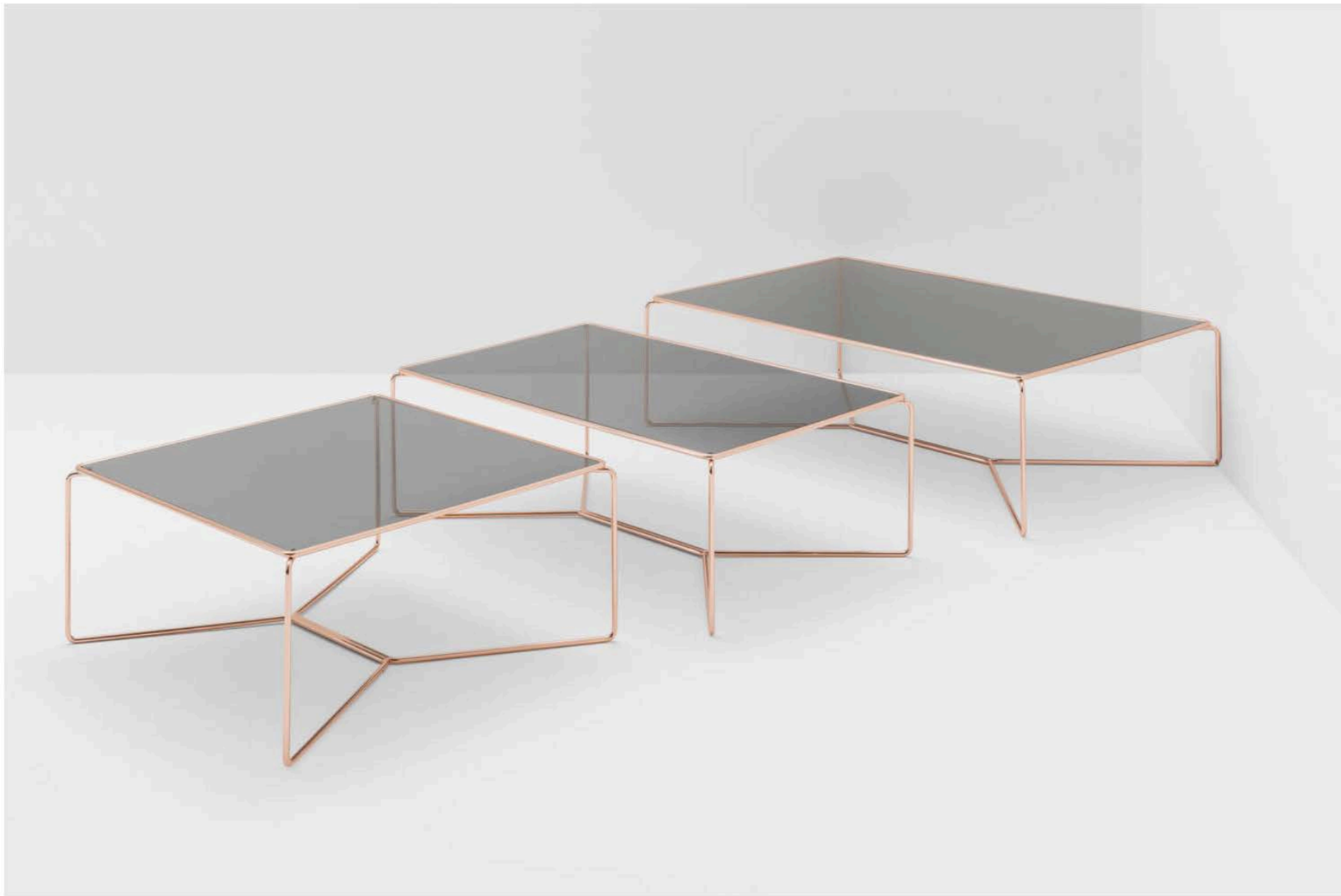
Marcel by Billiani

Tutte le proposte di Billiani sono accomunate dalla consueta fruibilità, e da un design che sa innovare senza ammicciare a mode passeggere.