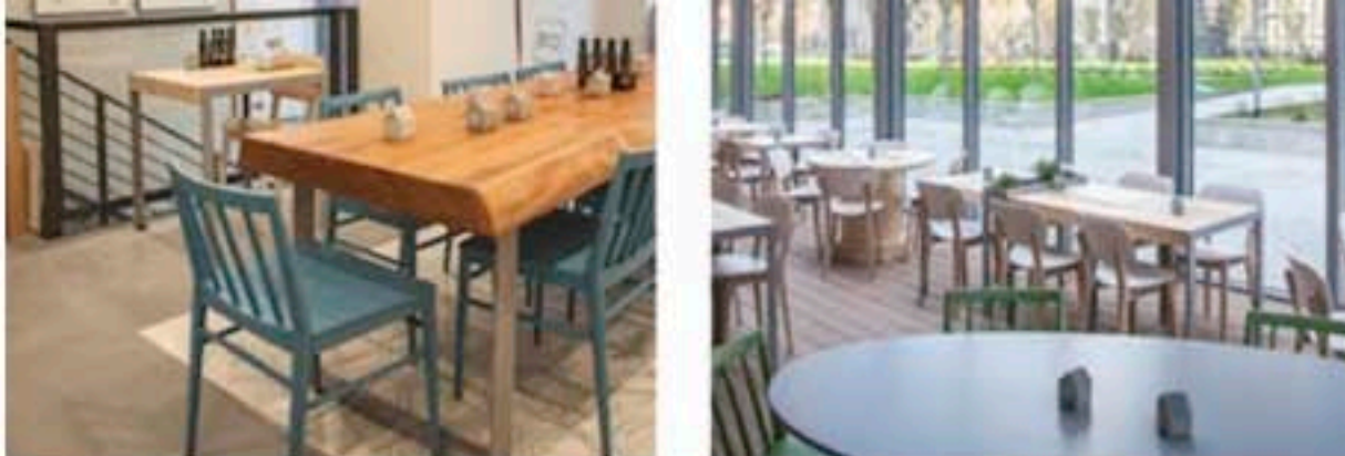
Per l'arredo sono state scelte le sedute Gradisca e Tracy di Biliani

Estremamente importante è la presenza di elementi naturali, sia all'esterno che all'interno del ristorante: qui, contenitori di essenze e piante aromatiche sono parte integrante della struttura dei tavoli, e alcuni vasi, realizzati in plastica riciclata, sono stati capovolti per ospitare del verde a caduta.