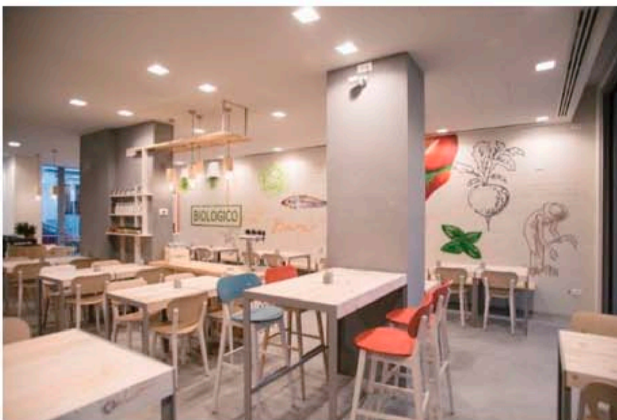
Una sala del ristorante con Gradisca in versione sgabello

Estremamente importante è la presenza di elementi naturali, sia all'esterno che all'interno del ristorante: qui, contenitori di essenze e piante aromatiche sono parte integrante della struttura dei tavoli, e alcuni vasi, realizzati in plastica riciclata, sono stati capovolti per ospitare del verde a caduta.