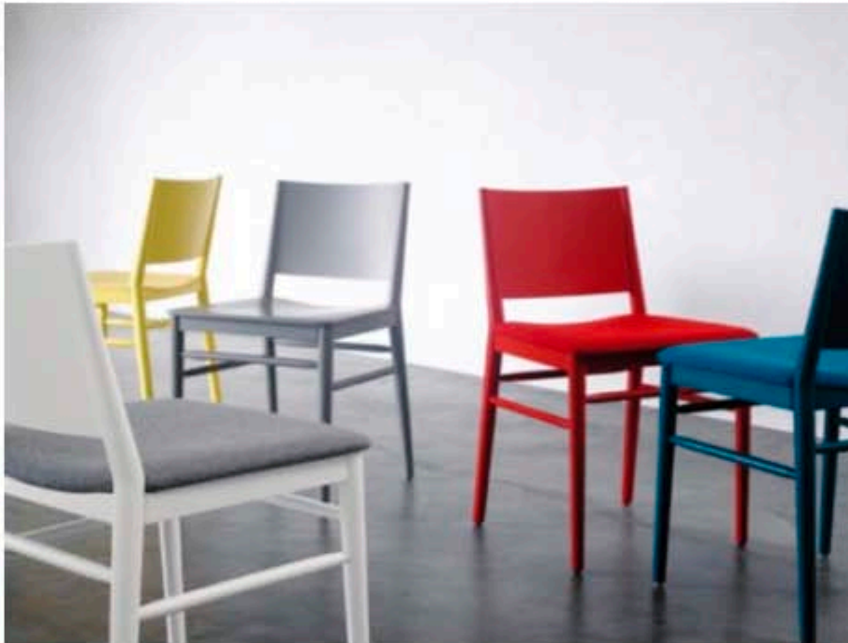
Tracy, design di Emilio Nanni

Non a caso sono state scelte anche le sedute di Billiani, storica azienda italiana, il cui lavoro è sostenuto da know-how artigianale, attenzione per il dettaglio, ricerca della massima qualità di materiali. Numerose le sedute Billiani usate in questo ristorante, per un totale di 130 circa tra sedie e sgabelli Gradisca in massello di faggio disegnate da Werther Toffoloni e sedie Tracy in massello di faggio tornito, con schienale in listelli in legno massello, disegnate da Emilio Nanni .