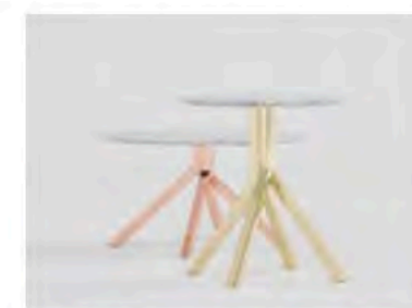
GRAPEVINE | Tavolo in marmo