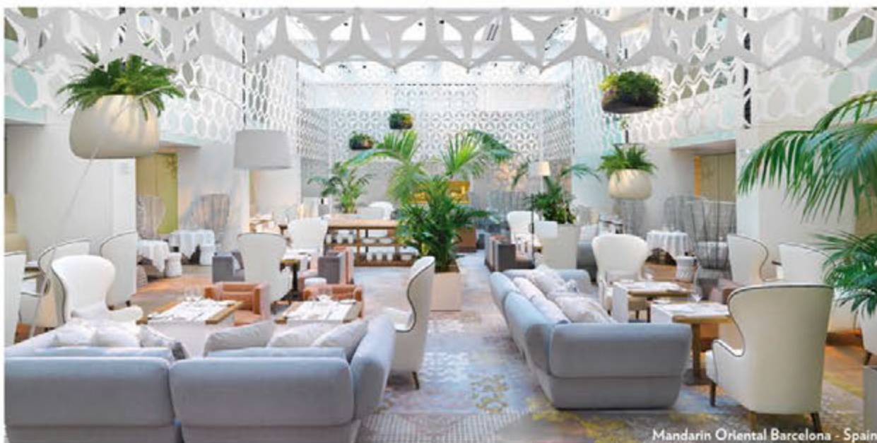
Mandarin Oriental Barcelona - Spain

Operating in the contract sector does not mean simply delivering a large number of products, but also providing information, advice, and assistance. Companies must be able to provide a flexible and updated service in order to meet the needs of individual projects. In this regard, the synergy between designers, companies, and clients is critical