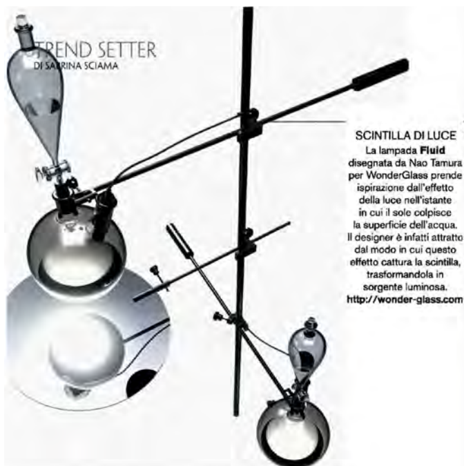
SCINTILLA DI LUCE La lampada Fluid disegnata da Nao Tamura per WonderGlass prende ispirazione dall'effetto della luce nell'istante in cui il sole colpisce la superficie dell'acqua. Il designer è infatti attratto dal modo in cui questo effetto cattura la scintilla, trasformandola in sorgente luminosa. http://wonder-glass.com